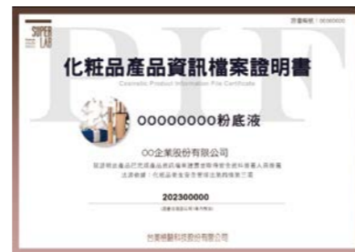
台美PIF產品證書預覽圖

產品資訊檔案 Product Information Files (簡稱PIF)，有關於化粧品品質、安全及功能之資料文件。現行國際間歐盟及東協早已施行，未來施行後將全面取代「特定用途許可證」核發，改由化粧品業者於產品上市前完成相關文件製備，並經「安全簽署人員」簽署後，才能販賣、贈送、公開陳列或試用，若為廠內試產階段，可不需要進行PIF。